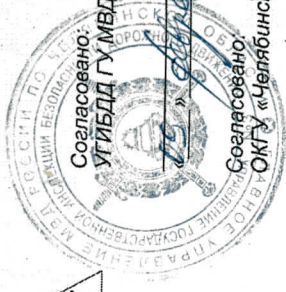
Схема организации движения транспорта на участках автомобильных дорог Карабаш-Белое Озеро-Косой мост с км 19+964 по 23+000 и Кыштым-Слюдорудник-Большие Егусты с км 16+000 по 20+176 с 10:00 до 13:00 19 февраля 2023 года при проведении автомобильного ралли

Согласовано: Управление дорожного хозяйства Министерства дорожного хозяйства и транспорта Челябинской области «___» _____ 2023г. ШИШАЕВ П. Г.