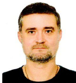
Офицер по связи с участниками