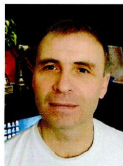
Старший судья парка сервиса